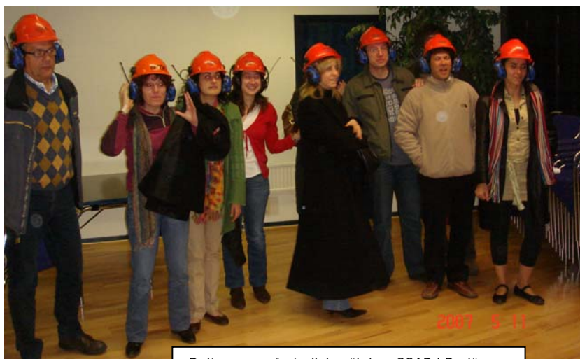
Deltagarna på studiebesök hos SSAB i Borlänge