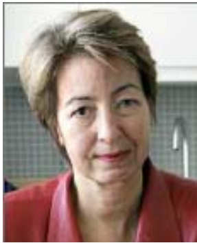
Överläkare Birgitta Evengård

Gender School hade bjudit in överläkaren och jämställdhetsvarige i Stockholms läns landsting Birgitta Evengård till ett seminarium på Grand Hotell i Falun den 5 december 2006.